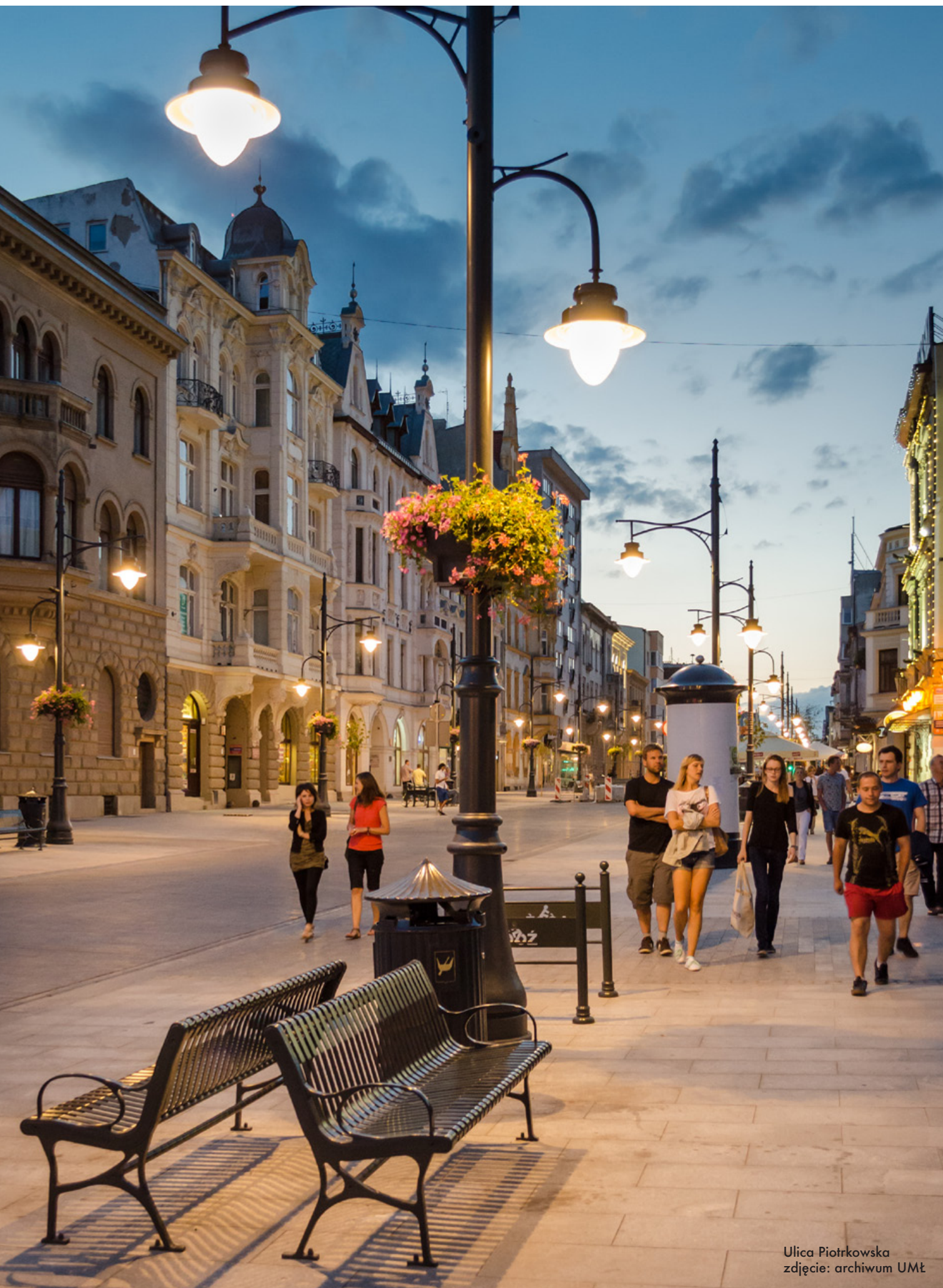
Ulica Piotrkowska